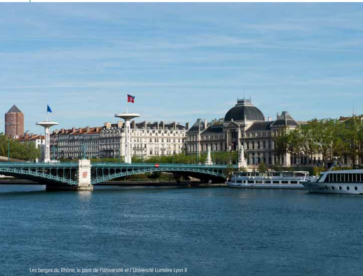
Les berges du Rhône, le pont de l'Université et l'Université Lumière Lyon II

Patrimonial sur sa partie nord, porté par une activité économique soutenue et de nombreux projets de renouvellement urbains sur sa partie sud, le 7 ème arrondissement de Lyon incarne un quartier dynamique, aux ambitions fortes. Pour habiter ou investir, il figure au rang des destinations les plus attractives de l'agglomération.