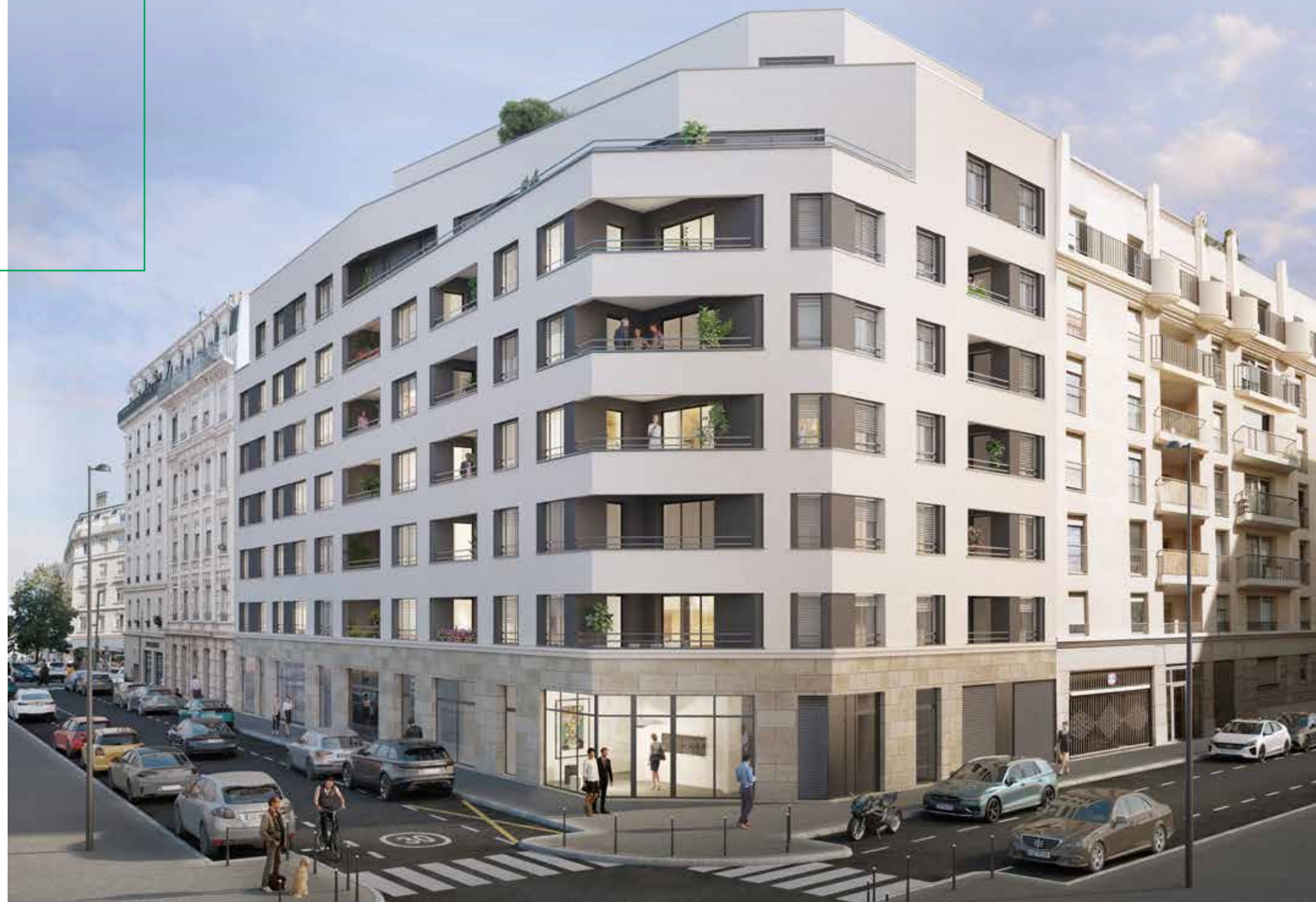
Vue de la résidence depuis l'angle des rues Saint-Jérôme et Jaboulay