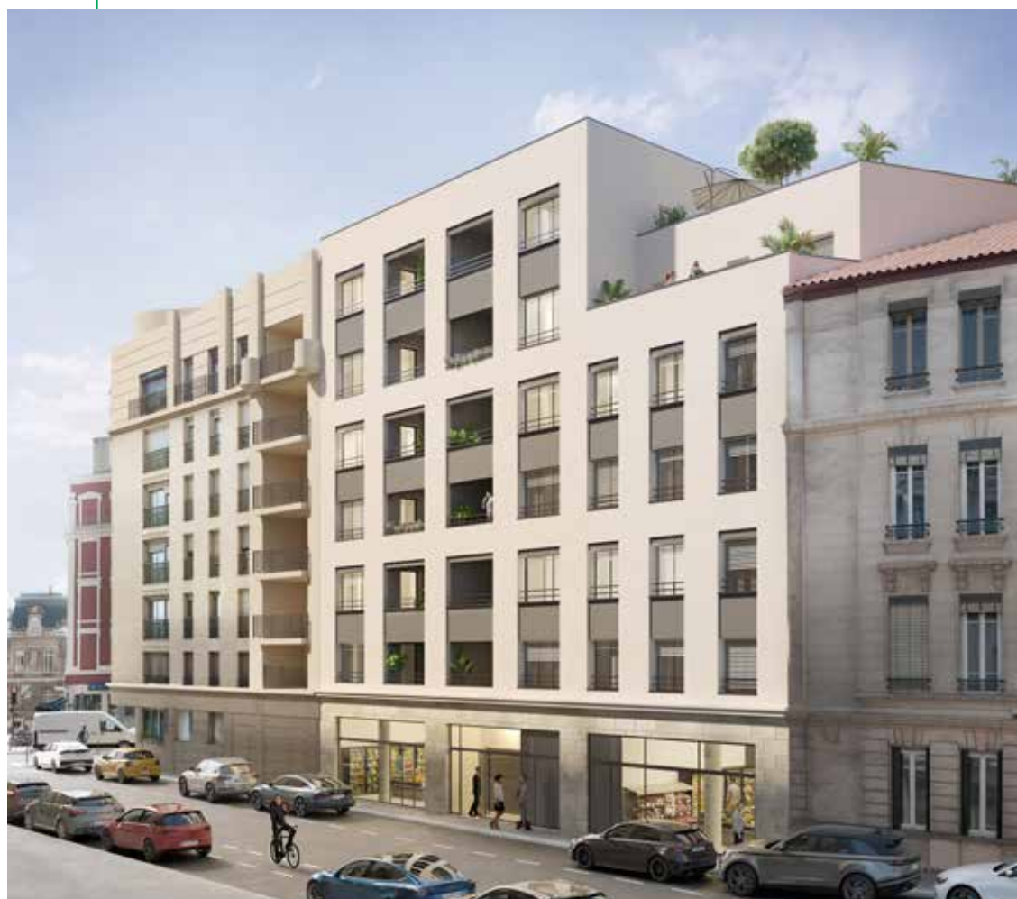
Vue de la résidence depuis la rue Renan

La résidence rend hommage à Cornélie Renan, épouse du célèbre écrivain, philosophe et historien français, Ernest Renan.