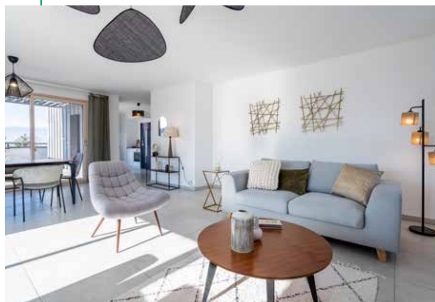
Réalisations UTEI données à titre d'exemple

Logements connectés : possibilité de gestion du chauffage et des occultations à distance