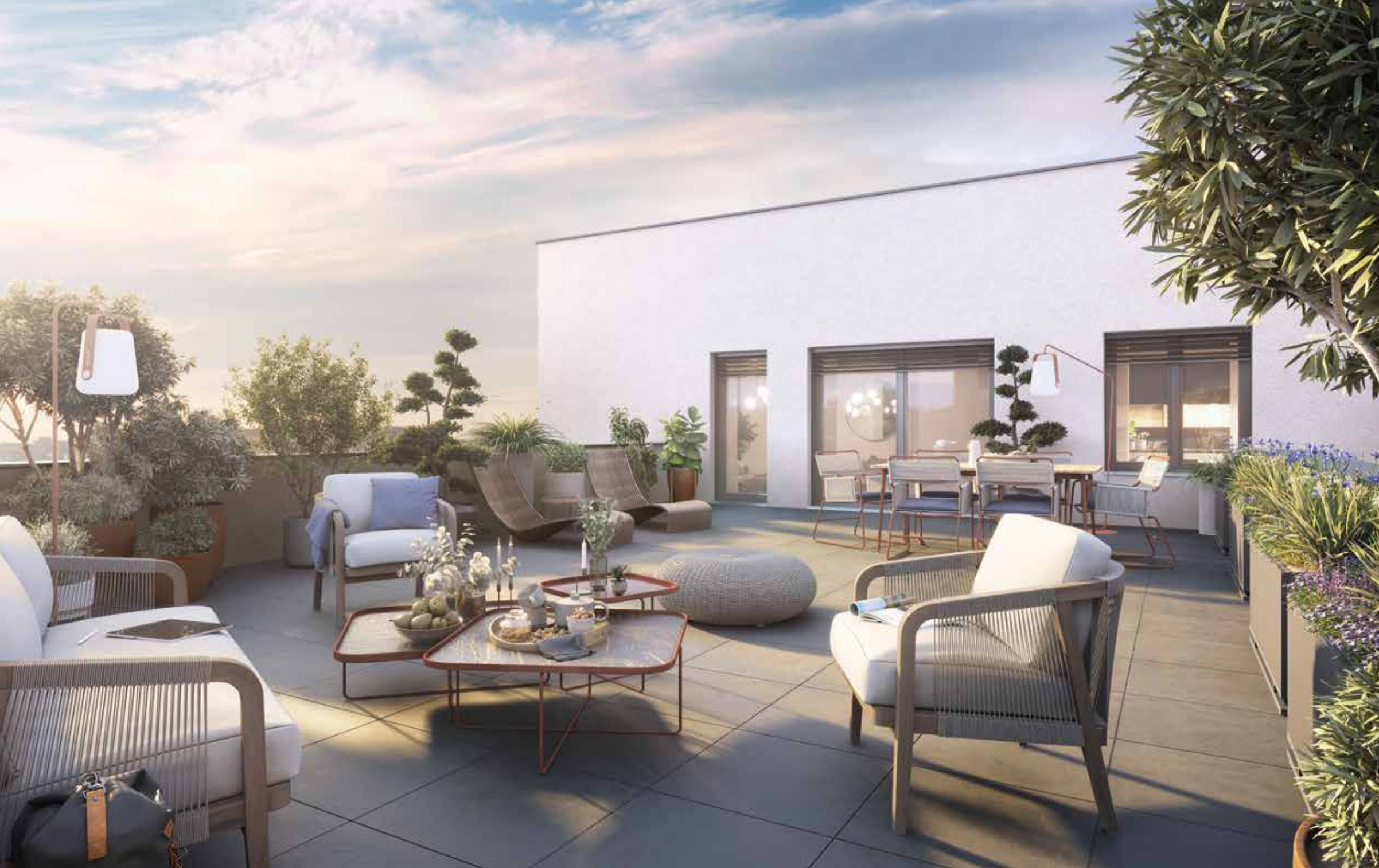
Vue d'une terrasse plein ciel