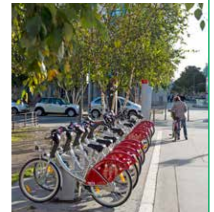
Station Vélo'v à 1 min* à pied de la résidence